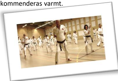
Träningspass på ett läger

Medlemskap. Alla medlemmar är förstas försäkrade genom gruppidrottsförsäkring för Svenska Karateförbundet i Folksam. Klubben är medlem i Riksidrottsförbundet och Svenska Karateförbundet. Medlemsavgiften erläggs vid starten på vårterminen och gäller hela året. Träning sker i Fågelskolan måndag 19:30-20:30 och Svaneskolan gymnastiksal onsdag kl 19:30 – 20:30 Från HT 2017 även ett pass 20:30-21 för 6 kyu/mon och uppåt på onsdagar. Träningsavgifter betalas per termin och är lite olika beroende på ålder/studier. Barn/Ungdomar (upp till 18 år) , Studenter och "vanliga" Vuxna. Familjerabatt finns för familj skriven på samma adress. Detta innebär att familjen aldrig betalar mer än maxavgift i träningsavgift per termin, oavsett antal (medlemsavgift är dock per person). Graderingsavgift tillkommer vid gradering. Läger förekommer regelbundet. Att delta i läger är förstas helt frivilligt, men rekommenderas varmt.