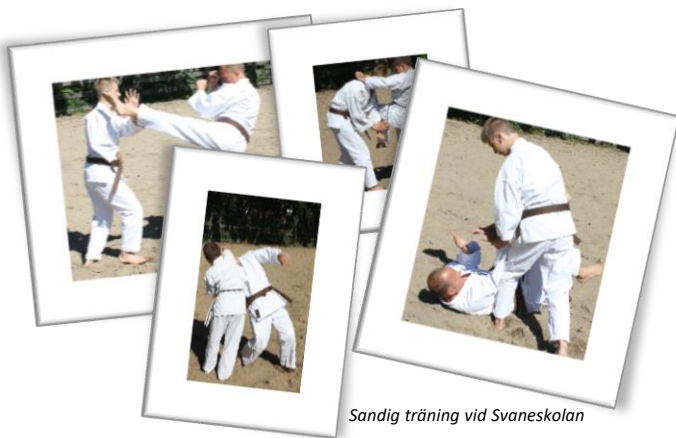
Sandig träning vid Svaneskolan

Vår karateutövning syftar till breda kunskaper i självförsvar, och vi tränar helt utan att tävla. Många av medlemmarna i Students of Goju Ryu är tex familjer som tränar karate gemensamt. Många uppskattar att vi inte delar in träningen i ålder utan efter färdighetsnivå, och få sporter lämpar sig så bra att träna tillsammans oavsett ålder och storlek, Varför sitta på bänken och vänta då ens barn tränar, bättre att träna tillsammans. Barn som tränar ensamma bör enligt vår erfarenhet vara ungefär i nioårsåldern.